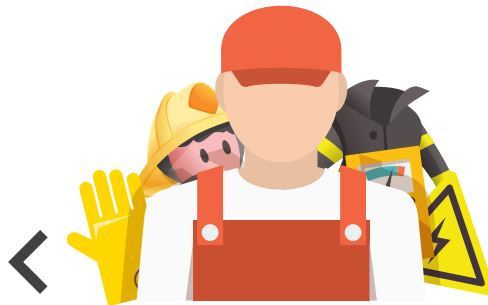
السلامة والصحة في مكان العمل