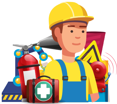
تكييف بيئة العمل لتناسب العامل

تطورت المعايير الدولية المنظمة لأحكام السلامة والصحة المهنية، من التركيز على السلامة الصناعي إلى السلامة والصحة في مكان العمل، وإلى تكييف بيئة العمل لتناسب العامل، ومن الحماية إلى الوقاية وتقييم المخاطر.